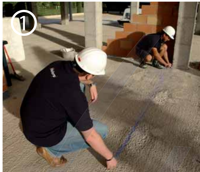
Colocar la tira donde se va a colocar el tabique.

Pellentesque habitant morbi tristique senectus et netus et malesuada fames ac turpis egestas. Nam tincidunt accumsan justo. Donec accumsan.