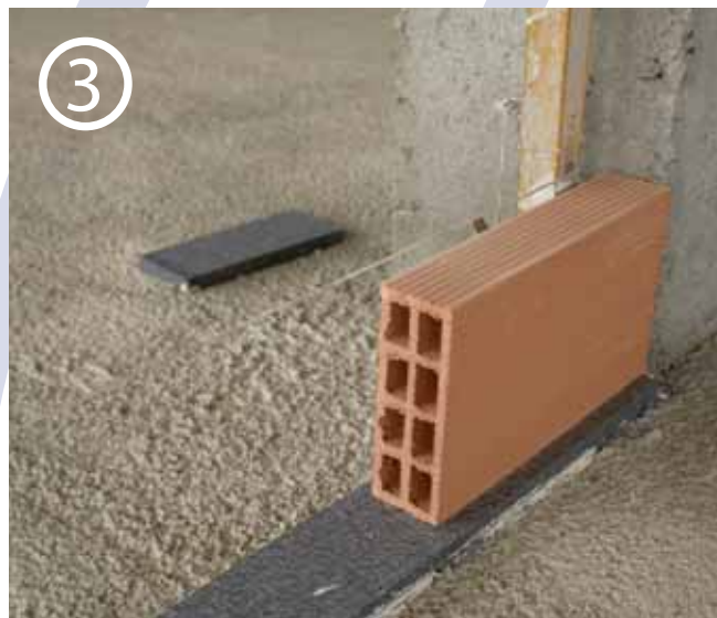
Colocar los ladrillos sobre la tira con un poco de mortero.