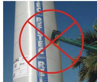
No aplicar el puntal directamente sobre el encofrado