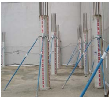
Con Sistema Ecoplom